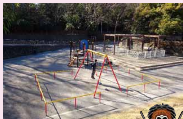
江古田の森公園 普段の様子