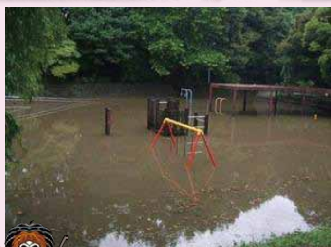
川の水が入った「江古田の森公園調節池」 (江古田川の氾濫を防ぐ調節池)